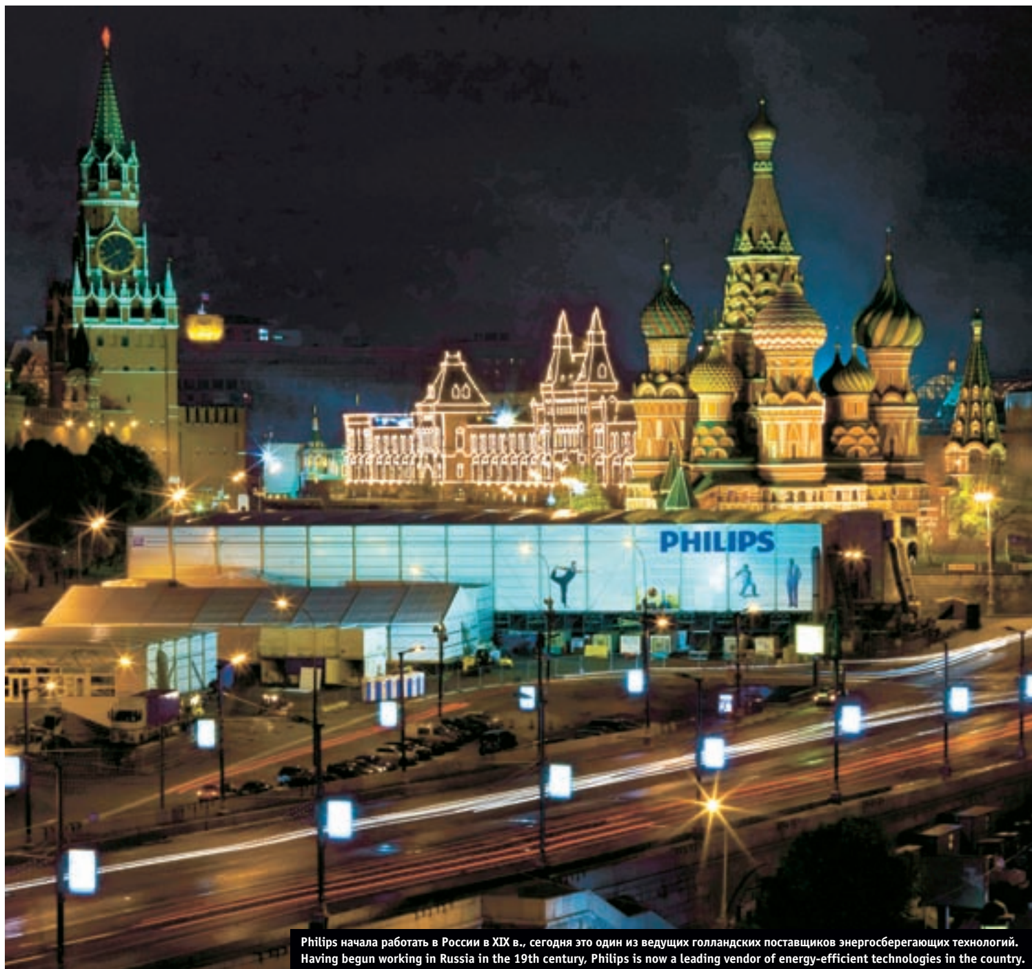
Philips начала работать в России в XIX в., сегодня это один из ведущих голландских поставщиков энергосберегающих технологий. Having begun working in Russia in the 19th century, Philips is now a leading vendor of energy-efficient technologies in the country.