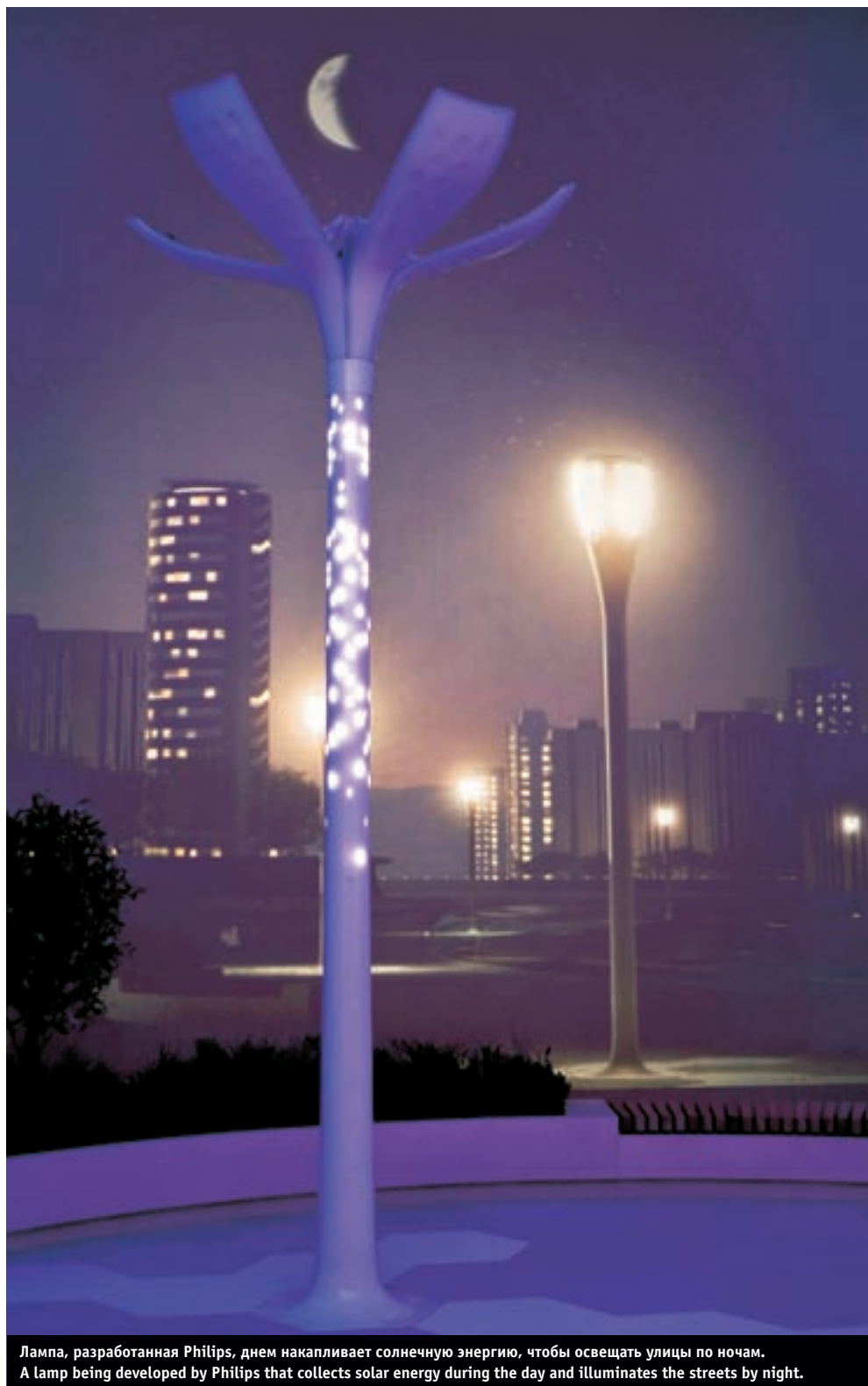
Лампа, разработанная Philips, днем накапливает солнечную энергию, чтобы освещать улицы по ночам. A lamp being developed by Philips that collects solar energy during the day and illuminates the streets by night.

“Our client base in the energy sector largely consists of Russian companies as it is there where the largest energy efficiency gains can be achieved,” said Ketting.